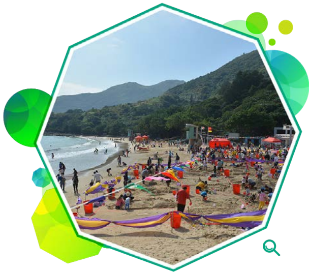
清水湾第二湾泳滩举行堆沙比赛和沙滩嘉年华，吸引大批游人。

为推广水上安全，年内本署与香港拯溺总会及其他相关的政府部门合办了一系列水上安全运动和活动。