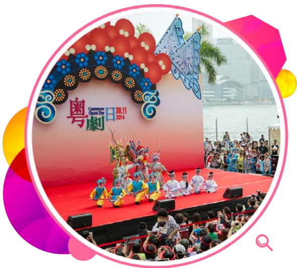
每年十一月最后一个星期日定为「粤剧日」，藉此推广粤剧艺术。

为使表演艺术普及化和将艺术带进社区，本署举办「粤剧日」和「舞蹈日」两项免费的大型社区活动，吸引大批不同年龄的市民欣赏和参与各项活动及表演。