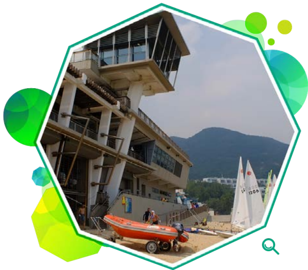
赤柱正滩水上活动中心是本署辖下五个水上活动中心之一。

本署负责管理五个水上活动中心（创兴水上活动中心、赤柱正滩水上活动中心、圣士提反湾水上活动中心、大美督水上活动中心和黄石水上活动中心）和四个度假营（麦理浩夫人度假村、西贡户外康乐中心、曹公潭户外康乐中心和鲤鱼门公园及度假村）。年内，共有12万人参加水上活动的活动，并有509 804人使用度假营设施。本署又举办黄昏营，让市民在公余时间参与营舍活动。在二零一四至一五年度，共有36 113人参加了这些活动。