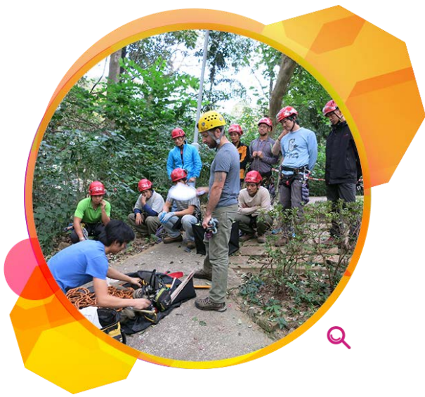
员工在攀树课程中检查器材。

为确保员工具备执行树木工作所需的恰当健康和安全知识，训练组亦安排了26名员工参加由发展局树木管理办事处和职业安全健康局举办为期两日的「树艺职业安全健康课程」。