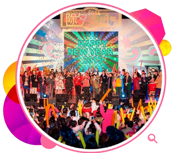
沙田公园举行「除夕倒数嘉年华」，吸引大批市民到场参加。

为庆祝中国传统节日及重要节庆，本署在年内举办了七个大型嘉年华，其中在沙田公园、沙田大会堂广场及城市艺坊举行的「2014除夕倒数嘉年华」，吸引3万人次参加。当晚多名年轻演艺菁英和青少年团体施展浑身解数，倾力演出多个精彩节目，包括大型拉丁舞汇演、森巴舞、巴西战舞、武术、乐队音乐、敲击乐、啦啦队、花式单车和摇摇表演等。