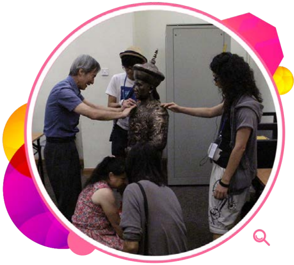
视障人士参加模型制作和触摸工作坊。

历史博物馆继续与香港小童群益会、保良局、协康会、香港新移民服务协会等本地社区团体和非牟利机构合作，于年内为长者、新来港定居人士、青少年和少数族裔人士举办「社区关怀计划」，通过各项推广活动，例如故事剧场和模型制作工作坊，增进他们对香港历史文化的认识和了解。