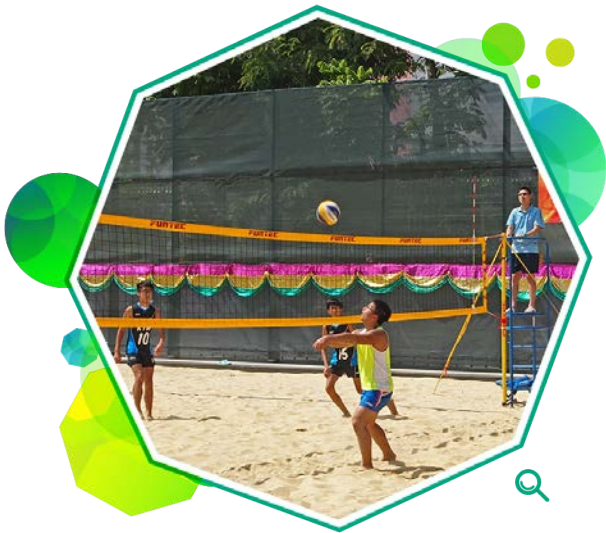
天业路人造沙滩球场为沙滩排球和沙滩手球运动提供新场地。

天业路人造沙滩球场位于天水围，是元朗区首个多用途沙滩球场，在二零一四年十月八日开放予市民使用。球场占地逾2 700平方米，适合进行沙滩排球和沙滩手球训练和比赛，并设有观众看台和淋浴间等设施。