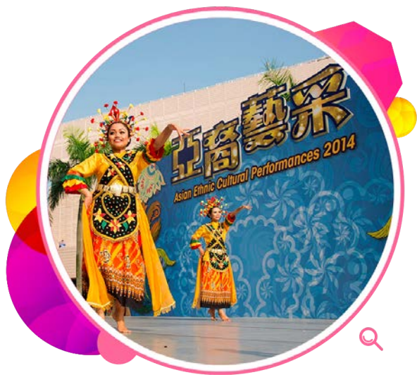
亞裔人士表演传统音乐及舞蹈。

为促进本地居民与居港亚裔侨民和睦共处，本署与孟加拉、印度、印尼、日本、韩国、马来西亚、尼泊尔、菲律宾、新加坡、斯里兰卡、泰国和越南驻港领事馆合办多项「亚裔艺采」表演节目。另外又与菲律宾驻港总领事馆合办「菲岛乐悠扬」音乐会，由菲裔乐手担纲演出。