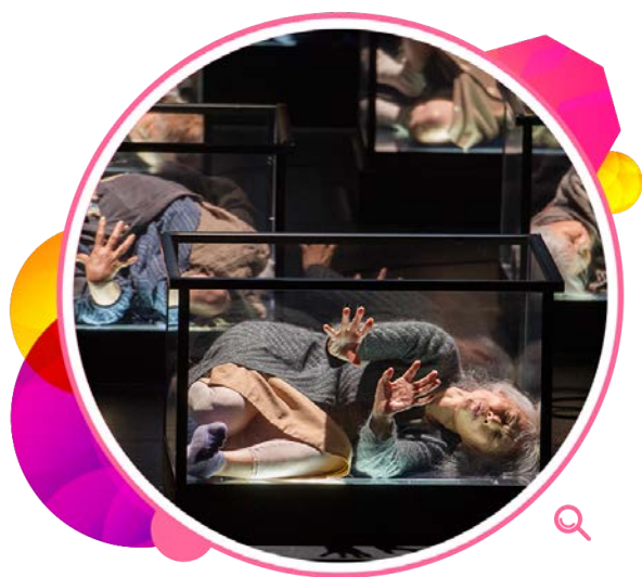
新视野艺术节上演的节目《乌鸦·我们上弹吧!》。