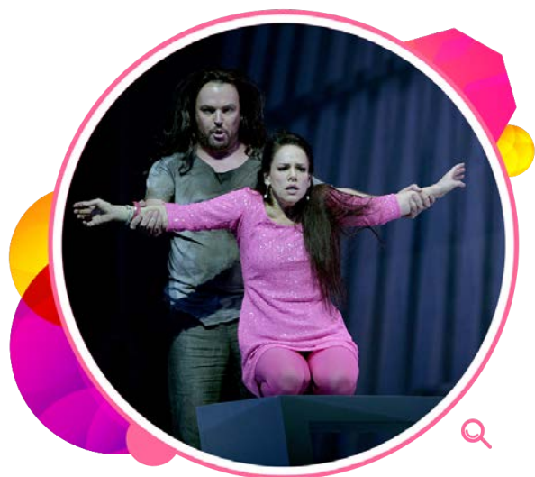
香港文化中心大剧院上演歌剧 《莎乐美》，图为其中一幕。

二零一四年为理察·史特劳斯诞生一百五十周年，本署举办一系列节目以纪念这位伟大作曲家，包括香港歌剧院呈献其歌剧名作《莎乐美》、小型放映会及讨论会、史特劳斯歌剧座谈会，以及由本地音乐家演绎其声乐及室乐作品。