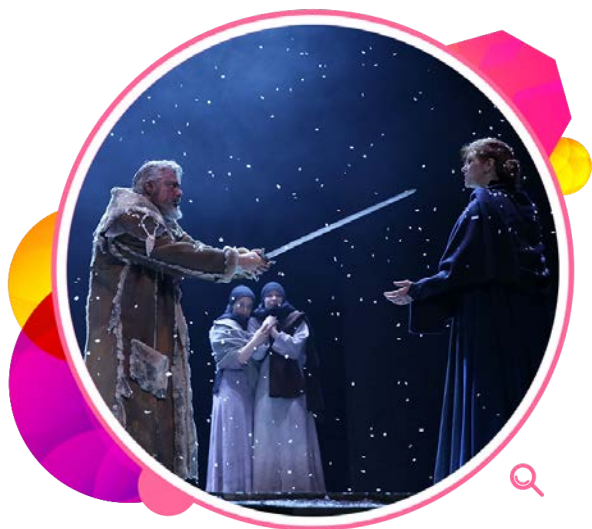
《马克白后传》延续莎士比亚的经典悲剧。

为庆祝高山剧场新翼开幕，本署呈献多个志庆节目，包括本地名伶演出的新编粤剧《大明烈女传》，著名的上海昆剧团演出经典剧目，以及香港话剧团的《一页飞鸿》。