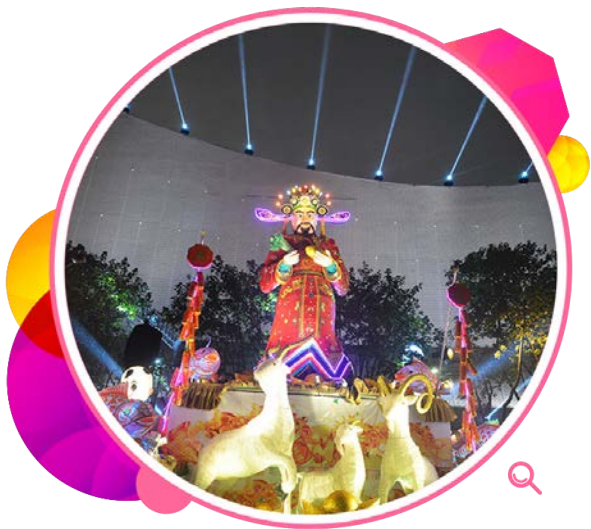
《三羊启泰迎财神》彩灯。