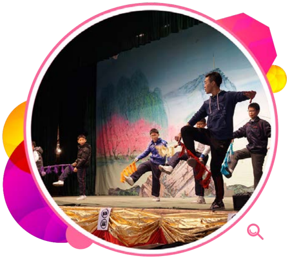
在元朗厦村乡戏棚举行的亲子互动活动。

此外，本署与国际演艺评论家协会（香港分会）合作举办「高中生演艺赏析计划」，通过讲座和工作坊，向学生介绍艺评的基本写作技巧。为提升学生对粤剧的兴趣，本署推出「戏棚粤剧齐齐赏」，在地区团体的支持下于多个不同地区的戏棚举行粤剧表演，并举办专为学生观众而设的互动和教育活动。