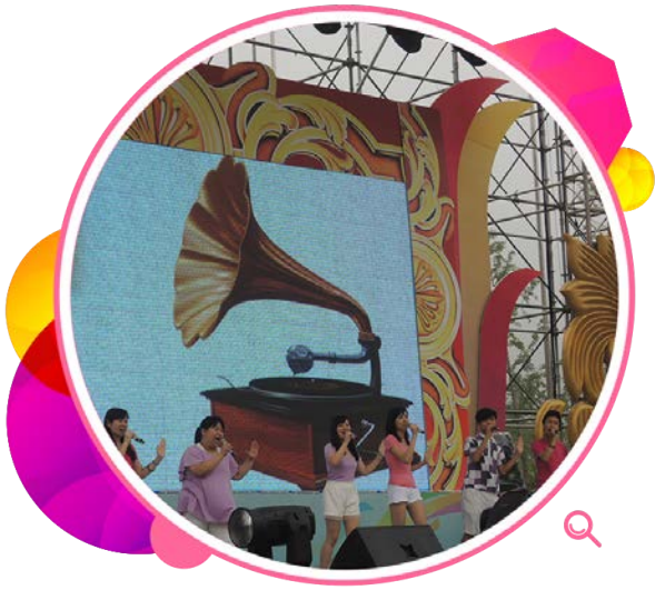
香港的无伴奏合唱团在「2014 青岛世界园艺博览会」上献唱。