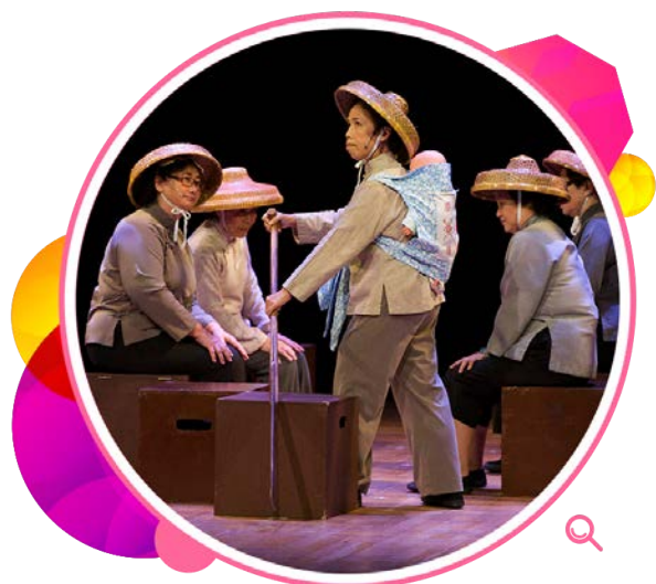
长者参与「社区口述历史戏剧计划」的演出。

为鼓励长者参与文化活动，本署与演艺团体和地区机构合办「社区口述历史戏剧计划」，通过一系列工作坊，搜集某些地区的长者的珍贵个人经历，把这些口述资料编写成剧本，让参与计划的长者有机会在台上演出自己的故事。这项计划在深水埗、观塘和离岛区（大澳）成功推行后，于二零一四至一五年度推展至东区。年内，为庆祝计划踏入第五年，本署在香港大会堂举行首个联区汇演，约有70名来自深水埗、观塘和离岛区的长者参与演出。