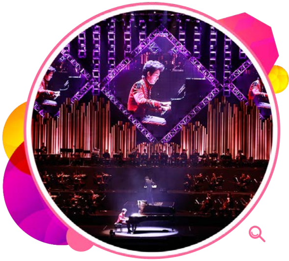
「李云迪王者幻想世界巡回演奏会」于二零一四年十二月在香港体育馆举行。