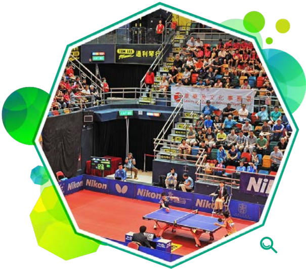
本地年轻乒乓球手参加「2014香港青少年公开赛—国际乒联青少年巡回赛」，磨练球技。

在二零一四至一五年度，共有72项国际赛事获得这项计划资助。主要赛事包括：「短池游泳世界杯2014—香港」、「第十九届亚洲城市金杯跆拳道锦标赛」、「香港城市田径锦标赛2014」、「第四十届香港国际保龄球公开赛」、「第三十六届香港赛艇锦标赛」、「2014年香港国际柔道锦标赛」、「香港青少年壁球公开赛2014」、「无装备香港卧推举邀请锦标赛2014」、「2014香港ASTC三项铁人亚洲杯」、「2014香港青少年公开赛—国际乒联青少年巡回赛」、「香港抱石锦标赛2014」，以及「全港青少年网球锦标赛2015」。