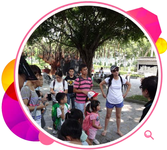
家长与子女一同参加九龙寨城公园的体验活动，认识九龙城区的历史文化。

区议会一向积极优化图书馆设施和阅读环境，不但提出新工程计划，而且为有关工程提供财政资助。区议会在二零一四至一五年度进行和完成多项工程计划，其中包括：提升和更换空调、照明和闭路电视系统等设备；更换壁画和室内陈设；提升视听和公众广播系统，以及为新流动图书馆服务站安装电箱和告示板。