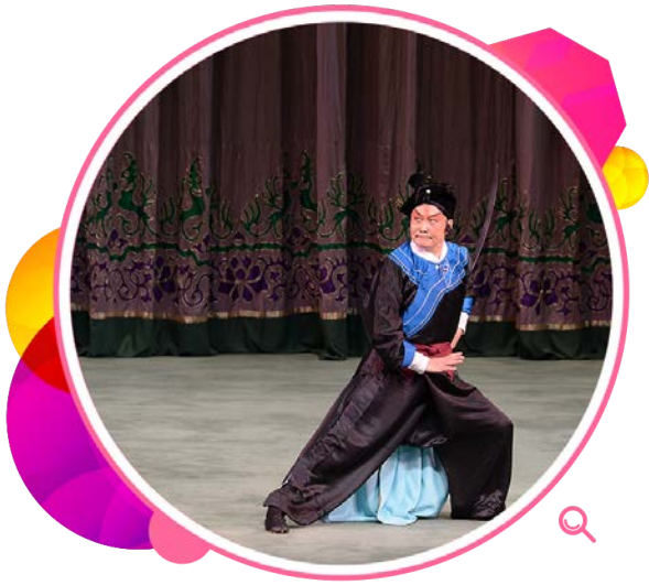
戏曲大师裴艳玲在第五届中国戏曲节作开幕演出。

为吸引年轻观众，本署在二零一四年推出「乐趣」系列，在新界场地举行极具创意的音乐会，分别由英国乌克兰乐队、著名古典音乐二人组意高文和朱亨基及加拿大铜管乐五重奏演出，观众反应热烈。