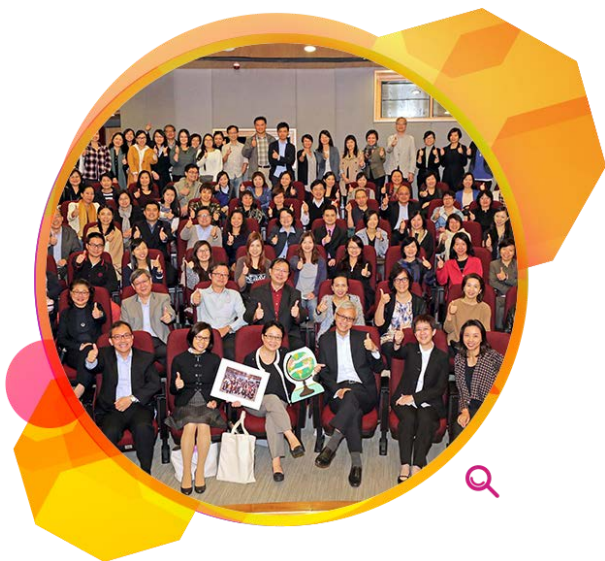
在「与DD(C)真情对话」员工分 享会上，部门副署长(文化)讲述 她的工作经验。

本署一向积极鼓励员工之间的知识管理及分享。我们举办的「一场同事分享会」系列，邀请不同范畴熟谙相关职务的同事主讲，与更多同事分享个人专业知识及工作心得。年内，同事亦就各类盛事及大型展览和一个国际会议的筹办工作交流经验。此外，我们还举办了《与DD(C)真情对话》及《文化事务部座谈会：回顾及展望》，让首长级人员与801名文化事务部员工分享他们的丰富经验。