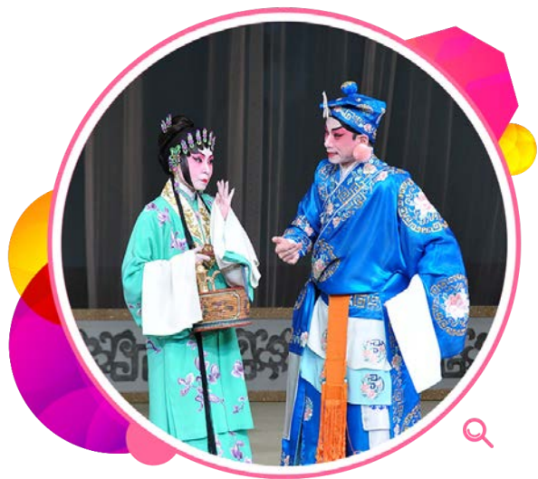
新编粤剧《搜证雪冤》其中一幕。