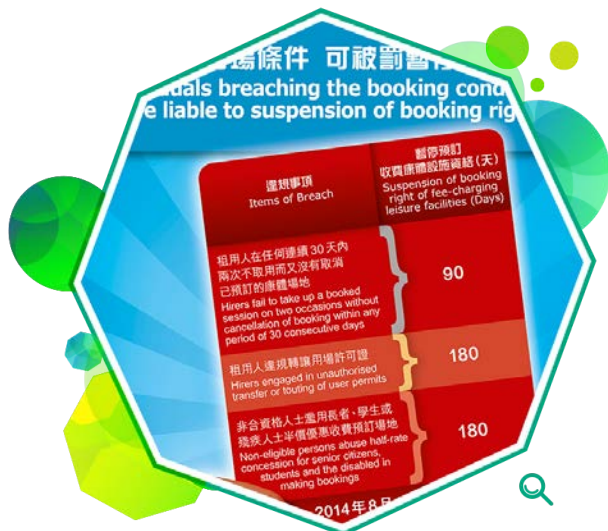
康体通电脑租订系统实施改善预订安排的新措施，图为宣传海报。