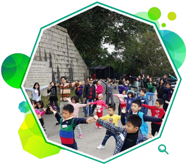
大小朋友参加「普及健体运动」的远足活动，起步前齐热身。

自二零零零年四月起，本署与卫生署携手推行「普及健体运动」，在全港18区举办各种健体推广活动。在二零一四至一五年度举办的活动包括：多项专为儿童、残疾人士和长者而设的健体计划；「行山乐」和「优质健行」等健行活动；「跳舞强身」活动；以及「跳绳乐」活动。