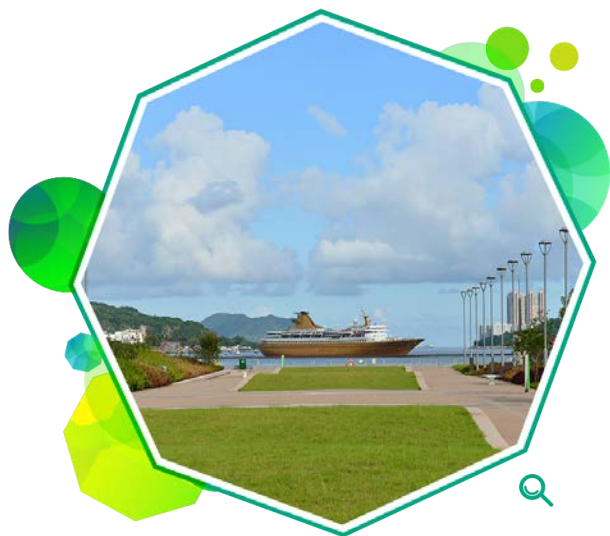
启德跑道公园的宽阔草坪坐拥维港两岸美丽景致。

启德跑道公园第一期位于机场跑道旧址的末端，占地约2.82公顷，设有海滨长廊和宽阔的草坪，并广植花木。市民可沿着行人道散步，欣赏鲤鱼门和观塘海滨的宜人景致。公园在二零一四年四月启用。