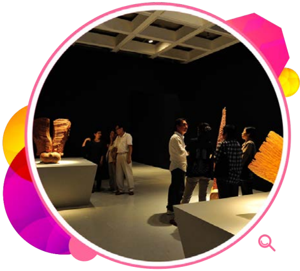
「诱惑触觉—唐景森的艺术」展览展出唐氏的23组雕塑。

香港雕塑界先驱唐景森备受尊崇，其艺术作品反映本地艺术家的卓越成就。「诱惑触觉—唐景森的艺术」展览向唐氏致敬，23组展品分别来自艺术馆、文化博物馆和唐景森夫人的珍藏。