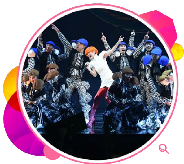
歌手孙燕姿在香港体育馆举行演唱会。

年内多位著名流行曲歌手在香港体育馆表演，当中包括本地艺人许冠杰、王菀之、草蜢、陈慧娴、张智霖、郭伟亮、杜德伟、薛凯琪、周柏豪、张敬轩、卫兰、郑秀文、邓紫棋、杨千嬅、朱咪咪，以及谭咏麟；而外地演艺组合则有苏打绿、五月天及艺人林宥嘉、丁当、孙燕姿和罗志祥。其他精彩节目包括：「Summer Pop Live in HK 2014—岁月友情演唱会」、「李云迪王者幻想世界巡回演奏会—香港站」、「演唱会之父·荣耀红馆SHOW」、「星光熠熠耀保良」、「黄子华栋笃笑唔嚟线唔正常」、「中国好声音·香港演唱会2014」、「香港同胞庆祝中华人民共和国成立六十五周年文艺晚会」、「庆祝佛诞节吉祥大会」、「消灾祈福大悲忏法会暨三皈五戒典礼」。香港体育馆年内举行多场国际体育赛事，包括「世界跳绳锦标赛2014」、「FIVB世界女排大奖赛—香港2014」，以及「二零一四香港公开羽毛球锦标赛」（世界羽联超级系列赛赛事）。