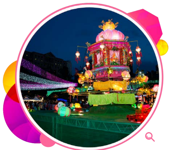
中秋佳节，维多利亚公园的彩灯耀目生辉。

本署在中秋节和春节期间举行盛大的彩灯会，重点节目包括由国家文化部港澳台办公室赞助分别来自北京和山西的艺团演出的大型民族歌舞和杂技表演。