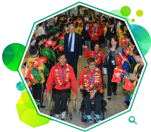
香港运动员参加二零一四年亚洲残疾人运动会后凯旋归来，受到市民热烈欢迎。

二零一四年亚洲残疾人运动会于十月十八日至二十四日在仁川举行。香港派出119名运动员参加14个运动项目，赢得10金15银19铜共44面奖牌。