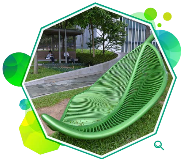
设于添马公园的叶形艺术品，欢迎游人坐卧。

添马公园毗邻新政府总部及立法会综合大楼，占地约1.76公顷，由二零一一年十月起分阶段开放予市民使用。公园内设有园景花园、特色水景、观景台、露天剧场、添马角及添马茶座，并有宽广的绿油油草坪，景观开阔，游人在享受休憩空间之余，可以欣赏维港美景。