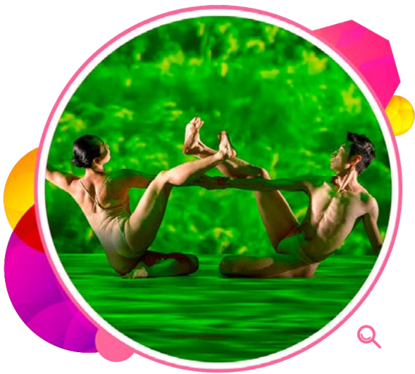
林怀民的《稻禾》是对大自然的 礼赞。

艺术节上演的戏剧节目不落窠臼。日本大师级导演蜷川幸雄率领埼玉金世代剧场的耆英演员，呈献动人心魄的《乌鸦·我们上弹吧！》。印度著名导演罗伊斯顿·埃布尔的音乐盛宴《人间百味》，声色味俱全，触动观众的五感神经。