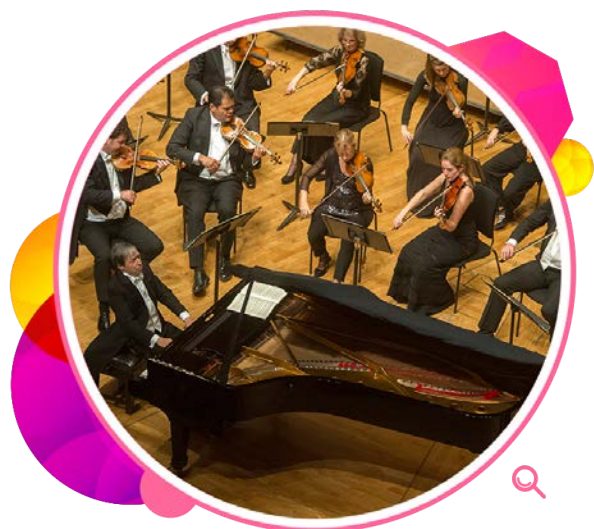
二零一四年十一月，柏拉雅与圣 马田乐团在香港文化中心举行两 场音乐会，座无虚席。

二零一四年亦适逢香港文化中心成立二十五周年，本署特别举办不同艺术形式的庆祝活动。音乐方面有柏拉雅与圣马田乐团携手演出，以及罗永晖全新创作的音乐剧场《落花无言》。此外，多位誉满全球的演奏家参与演出「喝采」系列，包括闻名遐迩的钢琴家祈辛、柏尼夫和普哥利殊，以及罗美路结他四重奏。