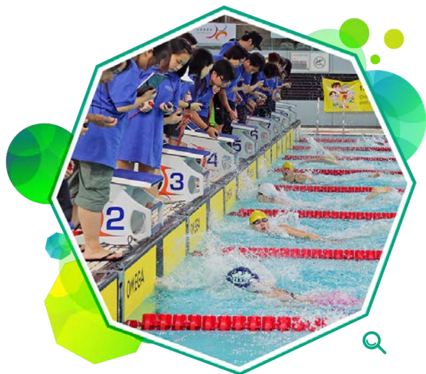
「全港运动会」游泳比赛中，运动员奋力争胜。

在二零零七年首次举办的全港运动会（港运会）是两年一度的全港大型综合运动会，以18区区议会为参赛单位。举办港运会的目的是在社区层面提供更多体育参与、交流和合作的机会，以及鼓励市民积极参与体育运动，从而在社区推广「普及体育」文化。港运会由体育委员会主办，并由其辖下的社区体育事务委员会统筹，本署联同18区区议会、中国香港体育协会暨奥林匹克委员会和有关的体育总会协办。