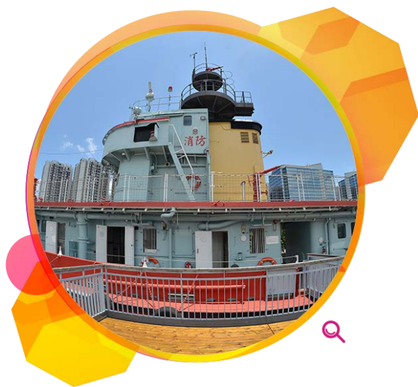
葛量洪号灭火轮展览馆。

此外，本署亦把辖下若干文化设施的管理服务外判。这些设施包括：香港文物探知馆、孙中山纪念馆、葛量洪号灭火轮展览馆，以及屏山邓族文物馆暨文物径访客中心。