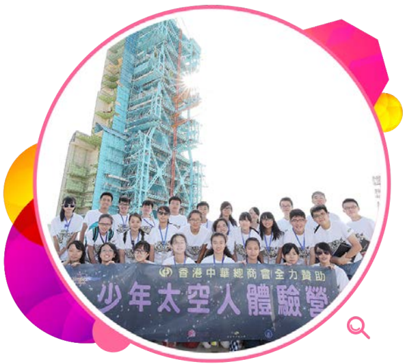
学员参观酒泉卫星发射中心，了解中国航天科技的发展。

二零一四年十月八日晚上，太空馆在星光大道举办路边天文活动，让市民透过仪器观测月全食这个特别的天文现象，藉以推广天文学知识。当晚，约有3 000人参与这项活动。