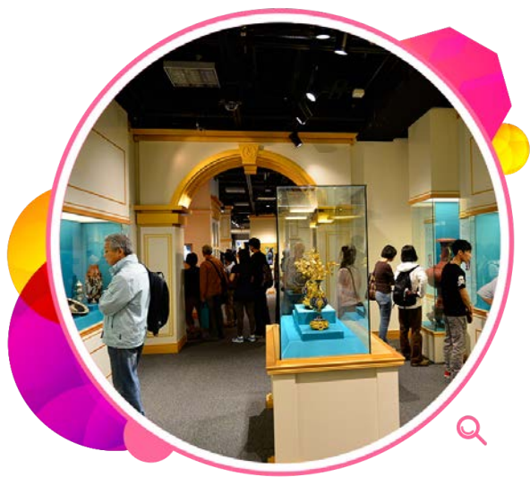
「皇村瑰宝：俄罗斯宫廷文物展」展出来自俄罗斯皇村的珍宝。

二零一四年十月，大型展览「皇村瑰宝：俄罗斯宫廷文物展」在香港历史博物馆揭幕。这是香港与俄罗斯签署文化合作谅解备忘录以来，两地博物馆首个正式合作的项目。展览透过国立俄罗斯皇村博物馆借出的逾200件珍贵文物，介绍俄罗斯在罗曼诺夫王朝统治下从十八世纪初期到二十世纪伊始的历史文化。