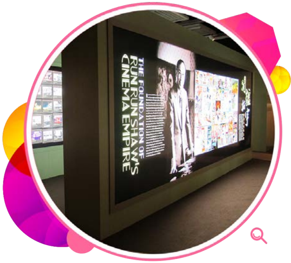
「开疆拓宇—邵逸夫电影王国」 展览回顾邵氏片场的辉煌传奇。

在二零一四至一五年度，香港电影资料馆继续努力保存于二零一二年年底从美国三藩市搜罗归来的一批一九三零和四零年代香港电影。这批电影非常珍贵，其中八部已于二零一五年三月的「寻存与启迪—香港早期声影遗珍」系列放映。资料馆更特别在香港文化中心露天广场举行两场户外放映，当中包括在一九四一年拍摄而其后经资料馆数码修复的《天上人间》。《香港影片大全》系列最新一卷在年内出版，内容涵盖一九七五至七九年摄制的八百多部电影。