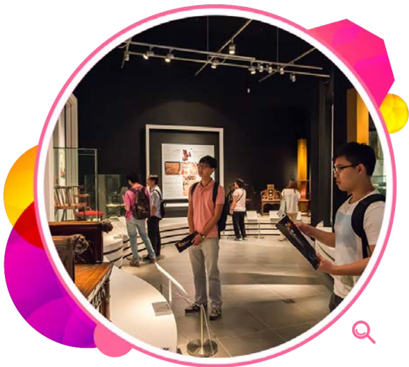
「卓椅非凡：穿梭时空看世界」 展览按照不同主题摆放椅子。

文化博物馆在二零一四年六月至九月期间推出新节目「请坐·请坐」，当中包括以椅子为主题的展览和教育活动。重点节目「卓椅非凡：穿梭时空看世界」展览与故宫博物院合办，由文化博物馆筹划。来自大英博物馆、英国国立维多利亚与艾伯特博物馆、美国布鲁克林博物馆、故宫博物院等世界著名博物馆的珍贵藏品，首度在香港展出。