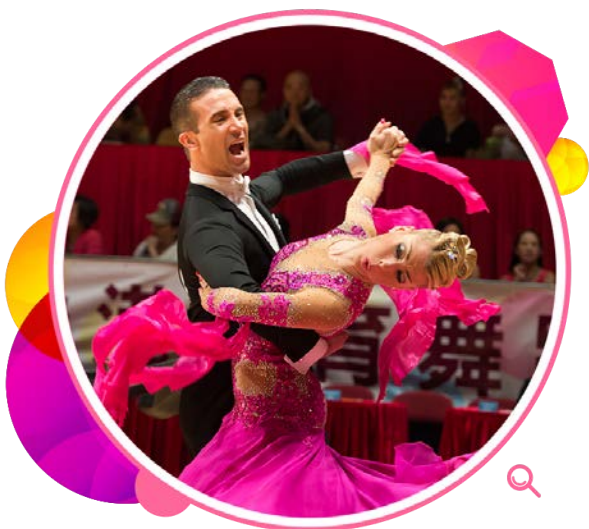
「第7届香港体育舞蹈节—WDSF世界体育舞蹈大奖赛香港2014」的舞蹈表演。

年内在伊利沙伯体育馆举行的大型体育赛事包括：「2014年香港篮球银牌赛」、「第7届香港体育舞蹈节—WDSF世界体育舞蹈大奖赛香港2014」、「2014年香港普及体操节」、「2014年闪避球联合会世界锦标赛」、「2014年香港篮球联赛」、「2014全港健美锦标赛暨第五届华南地区健美邀请赛」、「2014香港青少年公开赛—国际乒联青少年巡回赛」、「2014乒总杯」、「海峡两岸暨港澳地区泰拳邀请赛」、「第二十届超级工商杯国际篮球邀请赛」、「第五十一届学校舞蹈节—体育舞蹈」、「全港长者花式体操节2015」，以及「第58届体育节—香港健力锦标赛2015」。