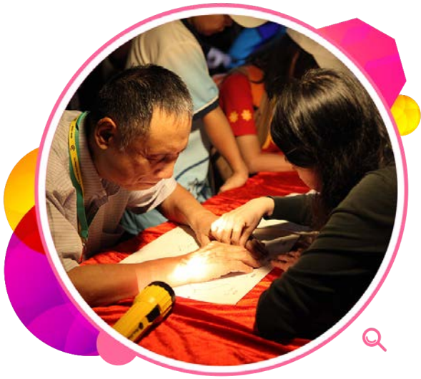
「盲人观星伤健营」参加者利用 凸字星图，学习星座知识。

太空馆在二零一四年九月推出免费的「星夜行」流动應用程式，网罗中西星图、天文资讯和相关活动资料。用户可透过流动电话或平板电脑，利用程式的双语录音资料以及实时计算位置的星图，随时随地辨认天体或星座，聆听有关星座的故事。程式自推出以来大受欢迎，至今录得超过46 000次下载。