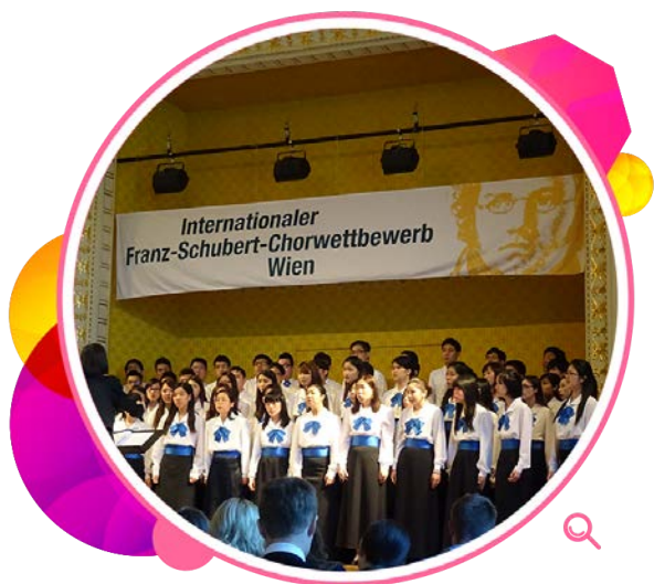
音乐事务处青年合唱团在维也纳音乐厅参加歌唱比赛。

音乐事务处辖下的青年合唱团于六月前往维也纳参加「二零一四年第二届维也纳『欢乐之声』合唱节暨第29届舒伯特国际合唱比赛」，作为事务处其中一项文化交流活动。青年合唱团表现出色，获评审团赞扬，赢得青年混声合唱及圣乐合唱两组比赛各一面金奖，以及青年混声合唱组的组别优胜奖。音乐事务处又为访港的日本、英国和美国青年音乐团体安排交流活动。