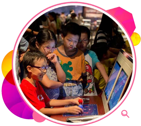
一名年幼观众操控「玉兔号」月球车的实物模型。