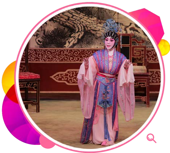
新编粤剧《大明烈女传》其中一幕。