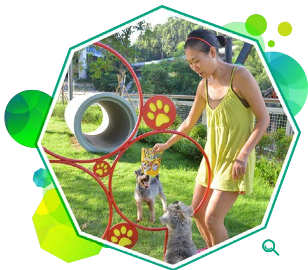
宠物公园设有多种宠物游戏设施，例如图中供狗只跳越的圈环。

在二零一四至一五年度，有四个新宠物公园启用，分别是乐民道宠物公园、富康街宠物公园、蒲岗村道 / 崇华街休憩处和蓝地宠物公园。