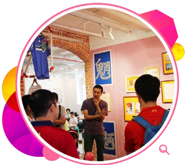
「火花！假如（在一起）」展览的客席策展人向在场观众介绍多款展品。